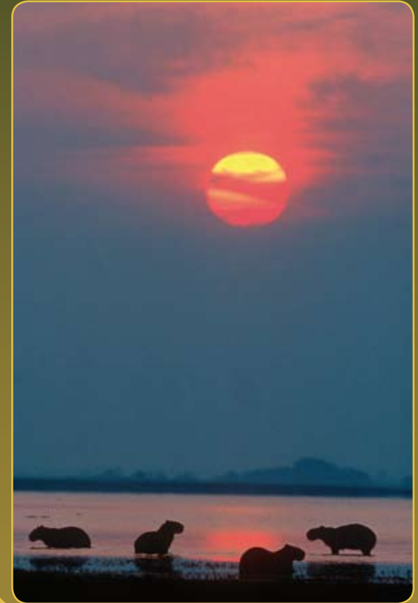
Chigüires/Capibaras en una laguna de la Estación Biológica El Frío (San Fernando de Apure, Venezuela) al atardecer.

Sensibilización de la sociedad madrileña sobre la lucha contra la pobreza mediante el uso del medio ambiente